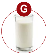
G Milch/Milch- zucker (Laktose)