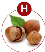
H Schalenfrüchte (Nüsse)