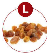
L Sulfid/ Schwefeldioxid