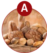
A glutenhaltiges Getreide